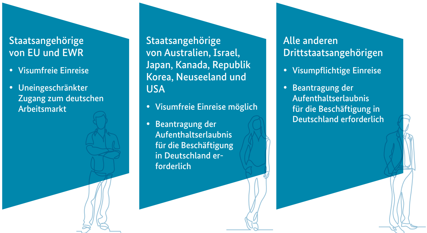
Abbildung 1: Zugang zum Arbeitsmarkt - Wer braucht ein Visum?

Die Bundesrepublik Deutschland hat, was die Einreise und den Zuzug von Fachkräften betrifft, mit einigen Staaten besondere Abkommen, die eine visumfreie Einreise ermöglichen. Für alle anderen gelten je nach Einreisezweck unterschiedliche Visaregelungen.