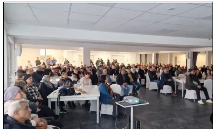
Reges Interesse: Ungefähr 60 Personen informierten sich.

Das große Publikum am Tag der Veranstaltung umfasste sowohl jüngere als auch ältere Menschen.