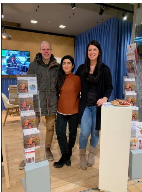
Wichtiger Bestandteil der altersgerechten Quartiersentwicklung: »Der Gute Lebensabend«.

Das Projekt »Guter Lebensabend NRW« wurde in 21 Kommunen in Nordrhein-Westfalen durchgeführt. Trotz des schwierigen Starts - ein großer Teil des Projekts fiel in die Corona-Pandemie - konnten viele Impulse gegeben und Maßnahmen erfolgreich angestoßen und umgesetzt werden. Die Politik konnte von der Notwendigkeit der Arbeit überzeugt werden. Die Stadt Remscheid sucht nach einer Möglichkeit die begonnene Arbeit fortzuführen.