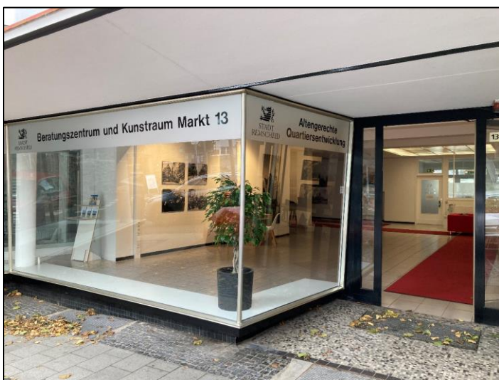
Zukünftiger Veranstaltungsort: Die Gruppe trifft sich ab 2024 in den Räumlichkeiten von Markt 13.

Beginnend ab Montag, 08.01.2024, sind die Treffen der Angehörigengruppe zukünftig im »Beratungszentrum und Kunstraum Markt 13« verortet. Das Angebot, das bereits seit 2019 existiert, findet immer am ersten Montag eines Monats (bei dem es sich nicht um einen Feiertag oder Brückentag handelt) ab 13:30 Uhr statt.