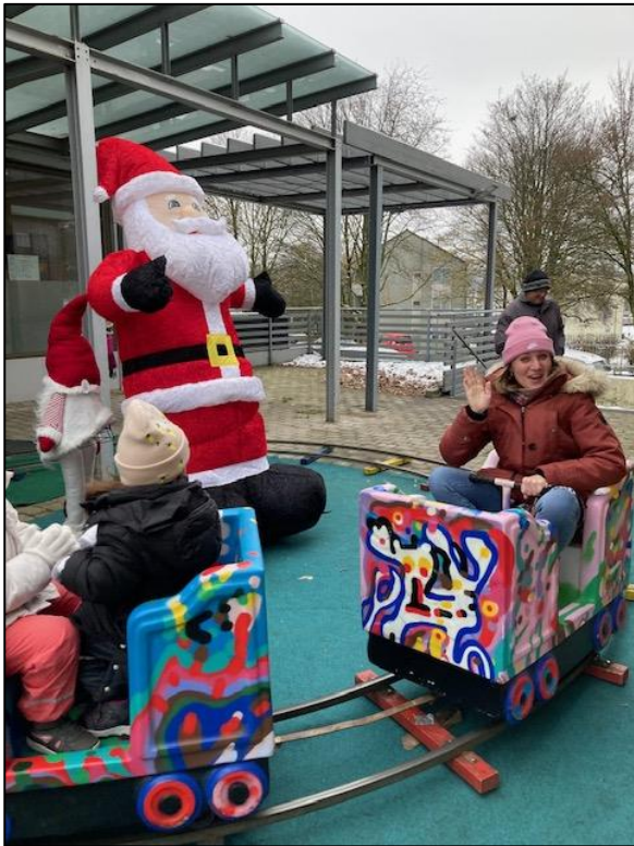
Löste nicht nur bei Kindern Begeisterung aus: Die Eisenbahn vor dem »Quartierstreff« in Klausen.

Zusammen mit den Familienzentren in Lüttringhausen fand Anfang Dezember eine Adventsfeier im »Quartierstreff Klaus« statt. Gemeinsam mit den Kindern aus dem Familienzentrum Klausen, den Jugendlichen der »Schlawiner« und den älteren Gästen des »Quartierstreffs« läutete das Team den Advent ein.