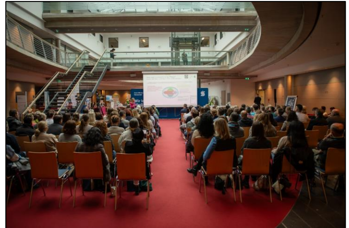
Großes Interesse im Forum Ovale: Weit über 100 Personen fanden den Weg ins Remscheider Sana-Klinikum.

»Wir sind begeistert über die wachsende Teilnehmerzahl. Die Rückmeldungen der Teilnehmenden haben auch in diesem Jahr unsere Erwartungen übertroffen.«