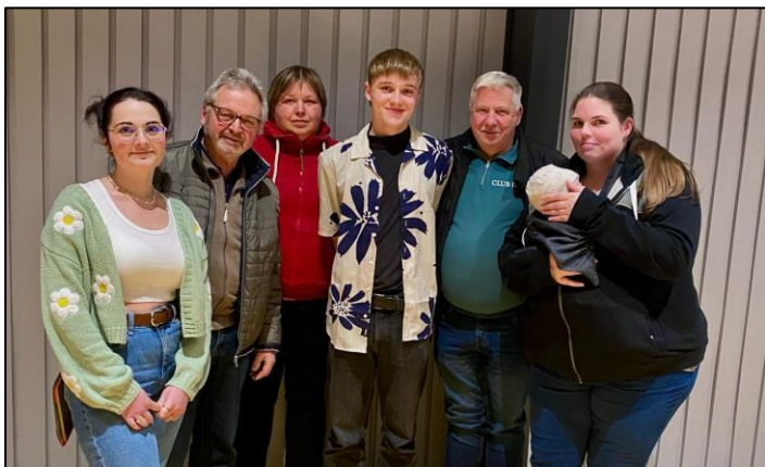
Der neue Vorstand des Bürgerhaus-Süd