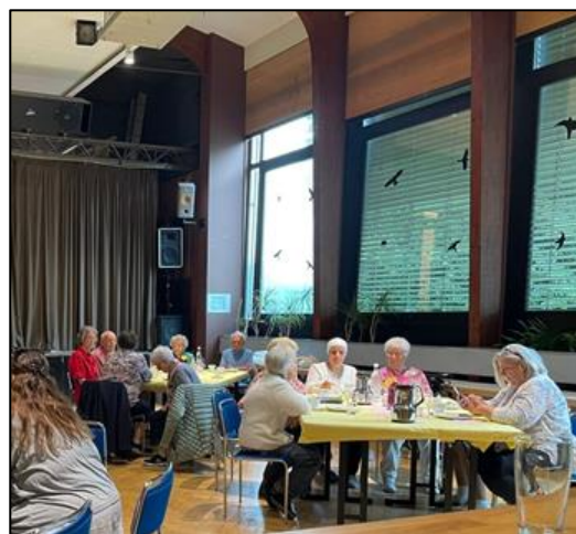
Zum Auftakt des Cafés gab es frische Waffeln

Das kostenlose Café ist ein Angebot des Bürgerhaus-Süd und der altersgerechten Quartiersentwicklung der Stadt Remscheid. Erstmals durchgeführt wurde das Format bereits im Jahr 2018 und hat sich trotz verschiedener Herausforderungen wie der Corona-Pandemie etabliert.