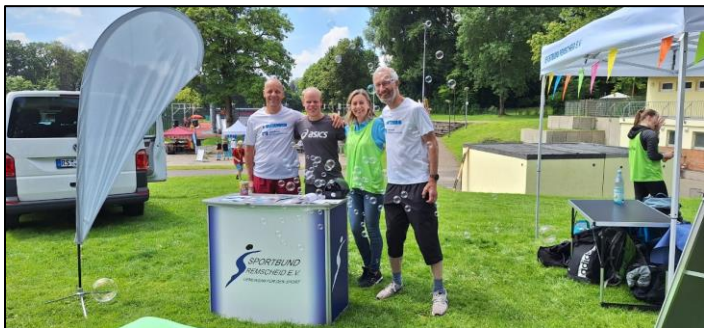
Auch das Team des Inklusionsprojektes #mittendrin war dabei

Die zweite Auflage wurde Ende Juni 2024 auf der Sportanlage Hackenberg ausgetragen. Zwischen 12:00 und 17:00 Uhr fanden über 1.000 Interessierte den Weg nach Lennep. Hier konnten verschiedene Sportarten wie zum Beispiel Yoga, Tennis oder ein Geschicklichkeitsparcours bei sommerlichem Wetter getestet werden. Das Ausprobieren war kostenlos möglich.