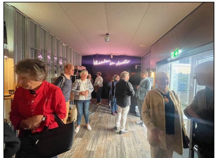
Austausch in entspannter Atmosphäre nach der Veranstaltung

Im Anschluss an die Vorstellung gab es im Foyer die Möglichkeit, mit dem Schauspieler und dem Team der altersgerechten Quartiersentwicklung der Stadt Remscheid ins Gespräch zu kommen. Insgesamt 35 Personen besuchten die Veranstaltung.