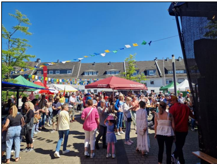
Das Fest am Honsberg war an allen drei Tagen gut besucht

Freitagabend wurde um den Boule-Wanderpokal „Honsberg v. Kremenholl“ gespielt. Es war sehr spannend, bis zur letzten Runde. Den Pokal konnte in diesem Jahr zum ersten Mal Kremenholl für sich gewinnen.