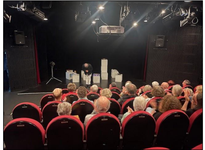
Über 30 Gäste fanden den Weg ins WTT