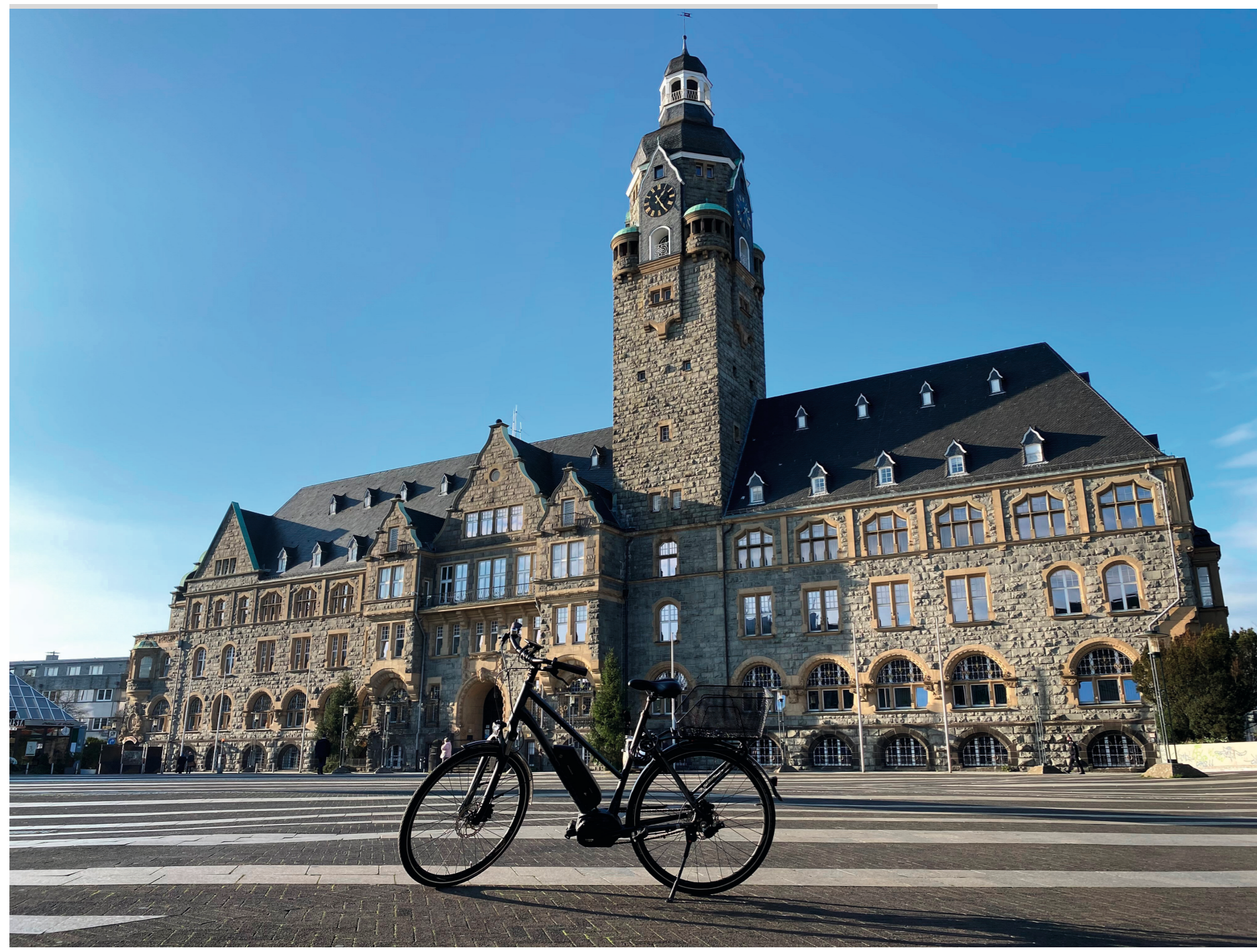
Urheber: Nikita Brilovics