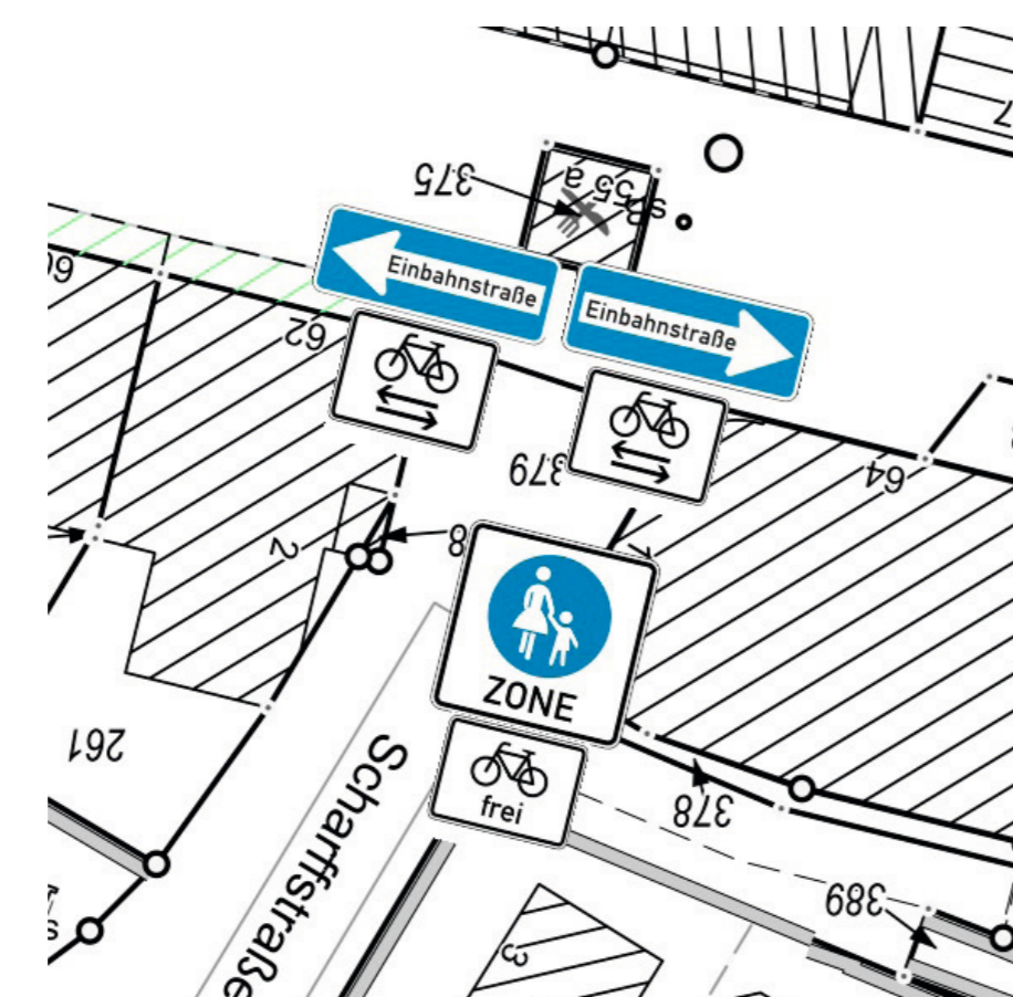
Urheber: Stadt Remscheid Elke Ellenbeck