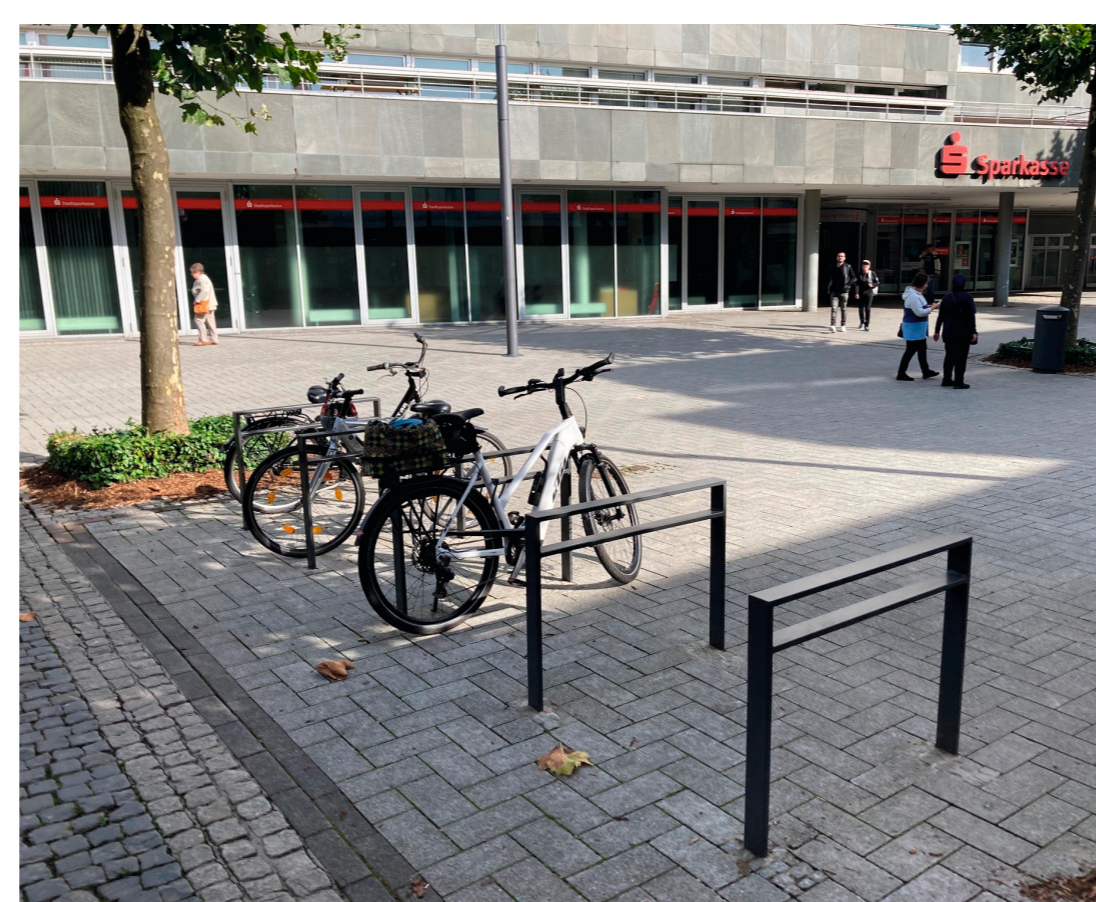
Urheber: Gamze Ates