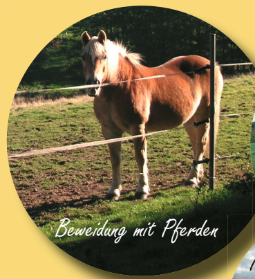
Beweidung mit Pferden

Das idyllische Paradies der Bachhaft Das Naturschutzgebiet Oberes Teufelsstal